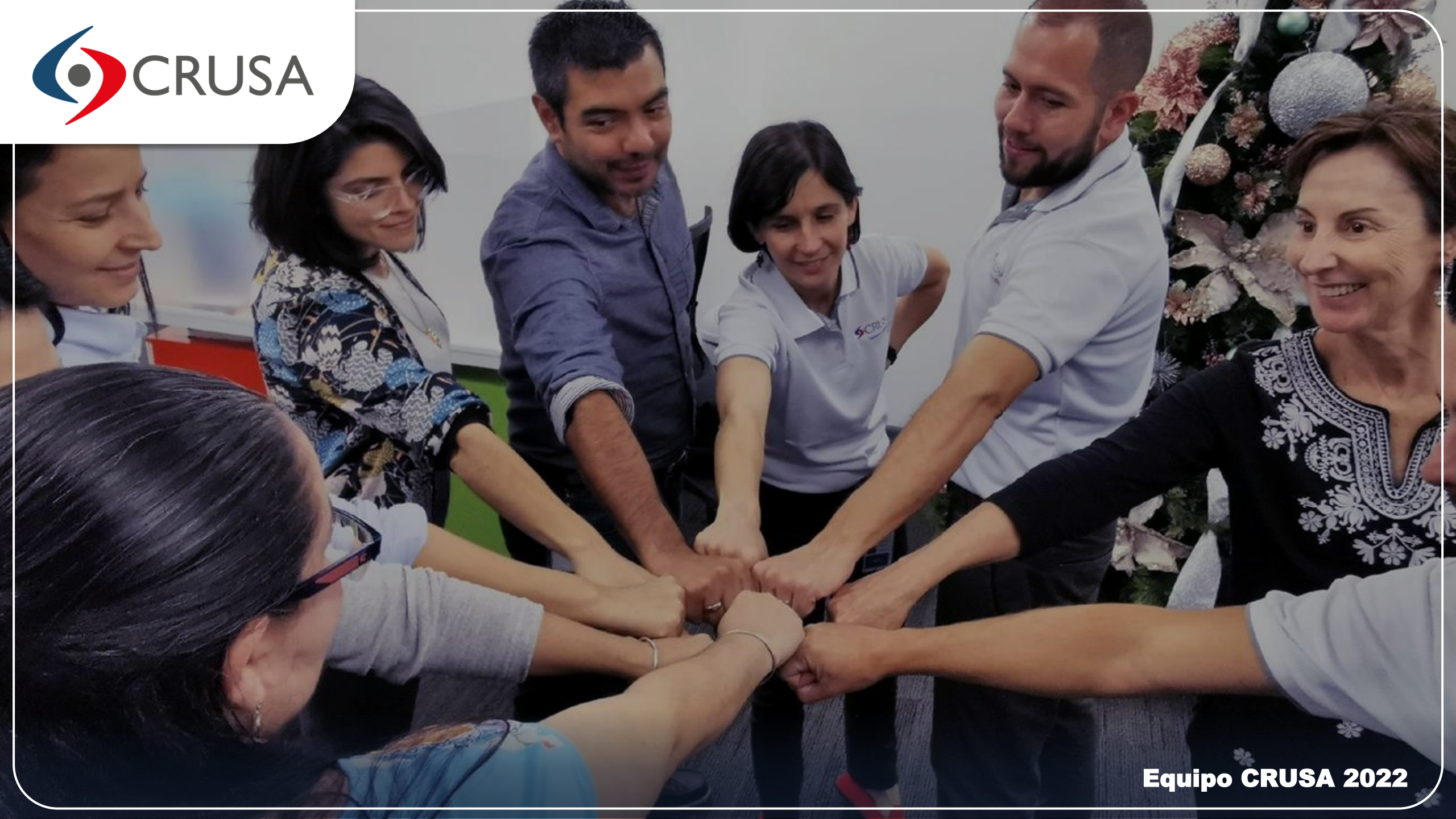
Equipo CRUSA 2022